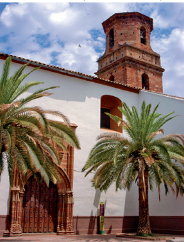
San Bartolomé Church. South façade and tower Agony in the Garden El Greco