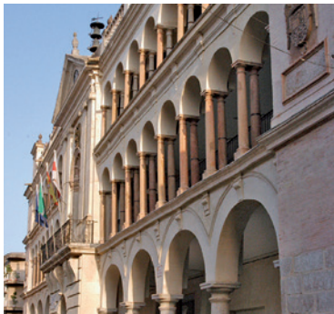
Casa de comedias (House of comedies), that today is the City Hall