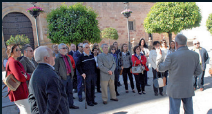
Visitas guiadas. Amigos de la Historia © Juan Vicente Córcoles

Sepa el viajero que a esta histórica ciudad de Andújar llega, titulada igualmente Muy Noble y muy Leal, de origen árabe, heredera de la antigua Isturgi (a unos 6 km de la actual Andújar), que será acogido con hospitalidad por sus vecinos, de carácter abierto y alegre.