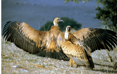
Buitres leonados

De los MAMÍFEROS destaca la presencia del Lobo y el Lince Ibérico , con la mayor población de España; el Melon-