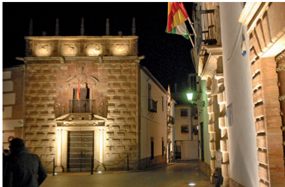
Palacio de los Cárdenas, de los Segundos de Cárdenas y fachada de los Pérez de Vargas