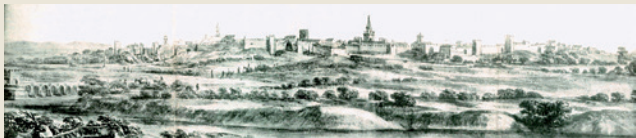
Vista de Andújar por Pier María Baldi. 1668

Andújar y su entorno han tenido siempre una situación privilegiada por ser una encrucijada de rutas comerciales con influencias artísticas y culturales de diversas procedencias.