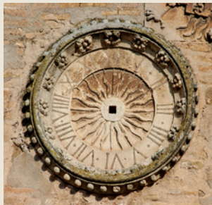
Torre del Reloj. Detalle

En la actualidad, es considerada una urbe moderna con una riqueza arqueológica importante, y un enorme desarrollo económico y social.