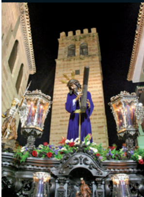
La Vera Cruz

This festivity begins on Palm Sunday with the Brotherhood of La Borriquita, followed by the processions during the week, which reaches its zenith on Holy Thursday and Holy Friday, when it ends. The different local brotherhoods are detailed below: