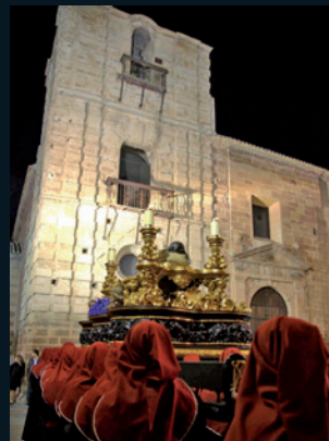
El Santo Sepulcro