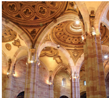
Principal transept of Santa María

From here, we will go to Santiago and Santa Marina Church , an old Arabic mosque; to Jesuits School (17 th -18 th centuries) with a baroque vault in the stair (imperial style), and to San Bartolomé Church (15 th -17 th centuries) which is an artistic historical monument. We are continuing by Calle Jesús María to the Convento Monjas Mínimas de Jesús María (15 th ), with Mudejar coffered ceiling in the main chapel, and then we can see the Virgen de la Cabeza painting (17 th -19 th centuries). We find this painting in a little outdoor chapel dedicated to the Virgen de la Cabeza: the patron saint of Andújar and of the Diocese of Jaén (with its pilgrimage the last weekend of April).