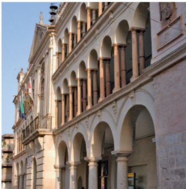
Casa de Comedias, actual Ayuntamiento