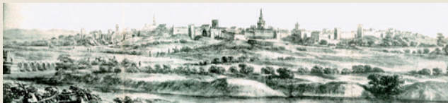
View of Andújar, by Pier Maria Baldi. 1668

Andújar and its surroundings have always had a privilege situation due to its commercial routes with different artistic and cultural influences.