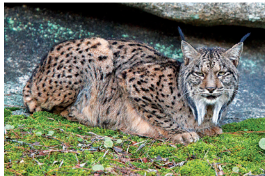
Lince Ibérico

illo, la Nutria , la Guarduña y el Gato Montés . De especies cinegéticas destaca el Jabalí y el Ciervo , tan abundantes que es frecuente verlos cruzar carreteras. Igualmente, conviven en esta tierra el Muflón , el Gamo , la Liebre y el Conejo , así como una pequeña población de Corzos y Carabras Montesas .