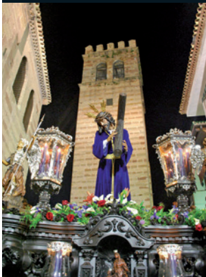
La Vera Cruz

Esta festividad da comienzo el Domingo de Ramos con la Cofradía de La Borriquita, sucediéndose las salidas procesionales en el transcurso de la semana, que alcanza su cenit el Jueves y Viernes Santo, cuando finaliza.