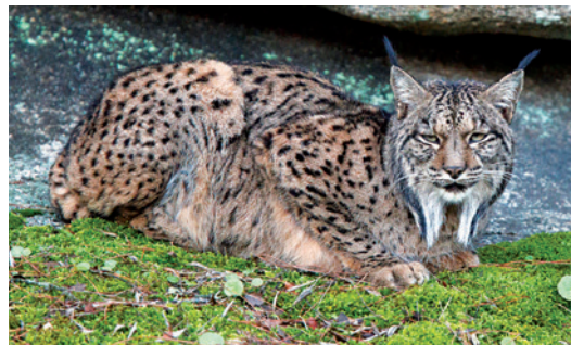
Iberian Lynx

Egyptian Mongoose , the Otter , the Stone Marten and the Wildcat . Between the hunting species highlights the Wild Boar and the Deer, species so abundant that it is common to see them cross roads. Likewise, there is a cohabitation in this land of the European Mouflon, the Fallow Deer, the Hare and the Rabbit, and also a small population of Roe Deer and Spanish Wild Goat.