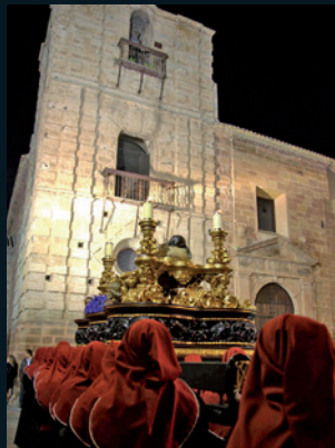
El Santo Sepulcro ©Carlos Ángel Gálvez