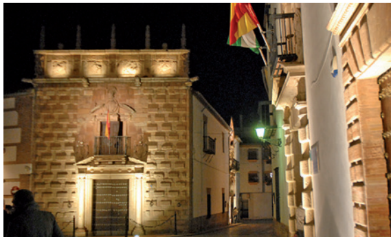
Palace of the Cárdenas family, Segundos de Cárdenas family Palace & Pérez de Vargas façade