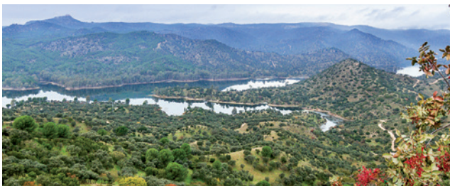
Sierra de Andújar Natural Park. In the background we see the Virgen de la Cabeza Sanctuary

Fauna Wolf, Iberian Lynx, Egyptian Mongoose, Otter, Golden and Imperial Eagles, Black Vulture, Eurasian Eagle-Owl, Wild Boar, Deer, Fallow Deer, European Mouflon and Spanish Fighting Bull.