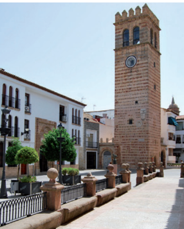
Torre del Reloj y portada de la casa de Albarracín