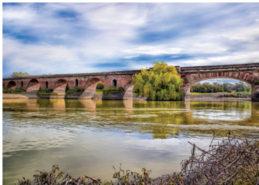
Puente romano

Ante todo estamos en una localidad llana , donde el paseo por sus calles y plazas es agradable. Deambule por su casco medieval, estrecho y tortuoso, que desde 2007 es 'Bien de Interés Cultural', con categoría de 'Conjunto Histórico' , declarado así por la Junta de Andalucía en su Consejo de Gobierno, debido a que la ciudad conserva valores urbanísticos y arquitectónicos que reflejan las etapas históricas de su evolución.