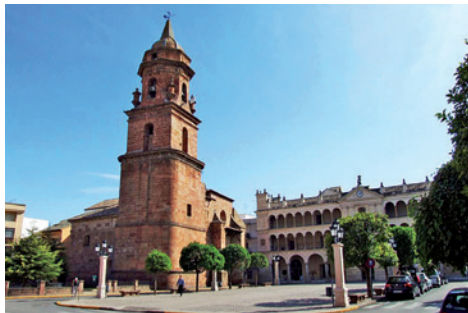
San Miguel Church & Casa de Comedias (House of comedies), that today is the City Hall