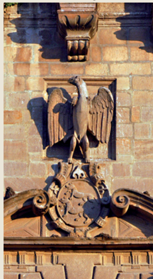
Niños de Don Gome Palace. Detail